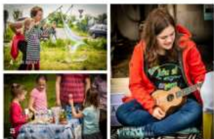
STÁNKAŘI Z JARMARKU

Poslední květnovou sobotu se v Záblatí u nového dětského hřiště konal zcela netradiční dětský den. Na začátku byla myšlenka využít dětskou fantazii. Nechat děti, ať ukáží, čím se doma baví, co vyrábí, co umějí. Uspořádat Pouliční jarmark dětských dovedností.